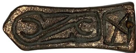
Késő avar kori bronz szíjvég

Az előbbieken némileg esett már szó a kiállítási tárgyak gyarapításáról , ami a kezdetek óta folyamatos. A legnagyobb méretű gyűjtőmunkát a helytörténeti gyűjtemény megnyitása előtt végeztük. Mivel a rendelkezésünkre került kiállítható anyag jószereivel elfért egy teremben, a többi négy helyiséget már csak az adományoknak köszönhetően tudtuk berendezni. Elmondható azonban, hogy ez tevékenységünk sem maradt abba, amit jelez az is, hogy immár több mint 5000 tárgy fölött rendelkezünk.