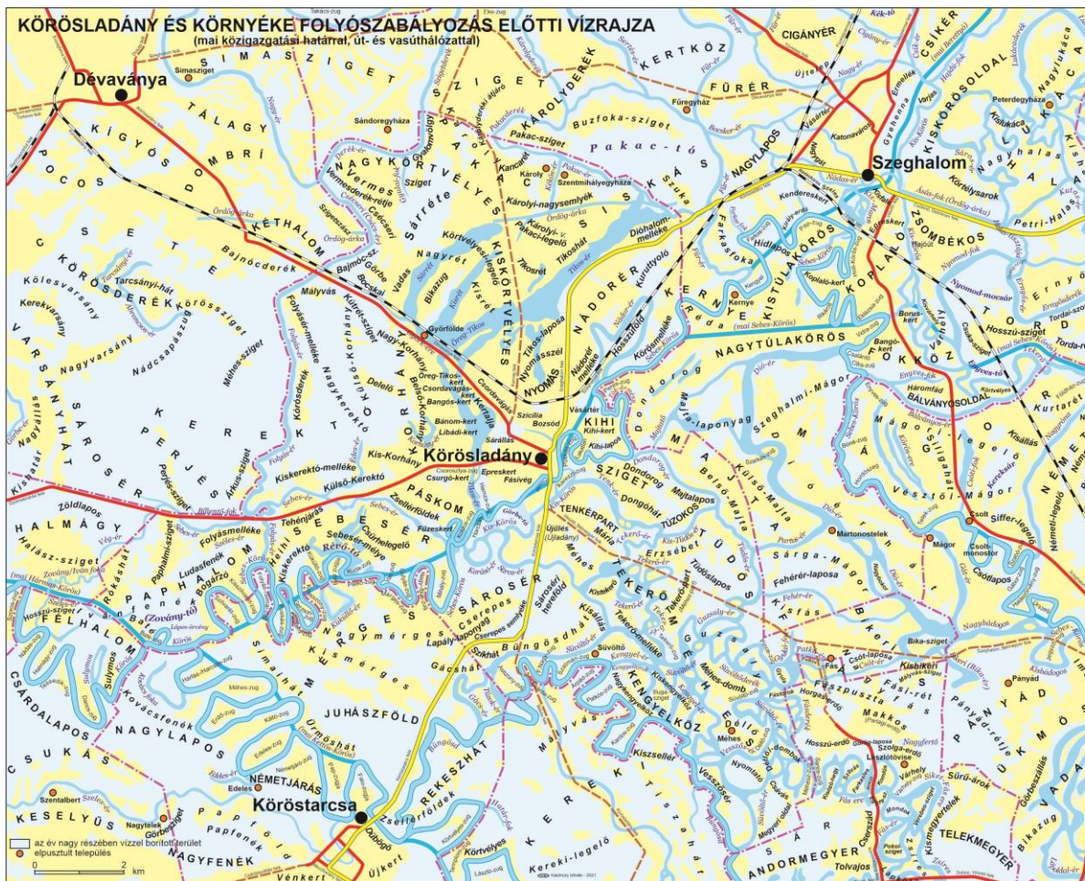
Körösladány természetes vízrajza a könyvből

negyedév. Ugyanis azt szeretném, hogy ezzel a munkával az év végére elkészüljek. Az apropót az adja, hogy ebben az esztendőben van Körösladány 1222-es első írásos említésének 800. évfordulója. Ez egy csodálatos évforduló, egyben kiváló alkalom, hogy elkészüljön a munka. Könyvekkel, forrásokkal a szó szoros értelmében felmálházva jövök dolgozni, illetve megyek haza. Az egyéb teendők miatt, amit nem tudtam délelőtt, délután megírni, azt otthon folytatom az estébe nyúlóan. A lényeg, hogy élvezettel teszem.