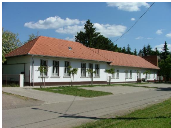
A Körösladányi Helytörténeti Gyűjtemények Háza

A Körösladányi Helytörténeti Gyűjtemények Háza (későbbiekben: gyűjtemény ) 2003. július 4-én, a Körösladányi Napok keretében nyitotta meg kapuját. Az idei esztendő volt az, amikor immár két évtizede szolgáljuk a látogatókat, érdeklődőket kiállításainkkal. Az eltelt időszak alatt a Körösladány Város Önkormányzata által hozott határozat alábbiakban megfogalmazott szempontjai alapján végeztük tevékenységünket: