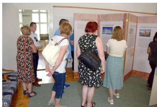
A kiállítás részlete

A járvány utáni, nehézkesen induló újrakezdéssel kapcsolatban kell megemlíteni az Alföldi Kéktúra vonalának meglepően kedvező hatását. Szinte hihetetlennek tűnt, hogy a rekkenő nyári meleg ellenére meglehetősen sok kisebb-nagyobb túrázó csoport, magányos kiránduló tért be a gyűjteménybe. Ezt csak kiegészíti az iskolával való szorosabb együttműködés, a tananyagot kiegészítő látogatások. Éppen úgy, mint a nyugdíjas klub által szervezett udvari programok, amelyből sohasem hiányzik a kiállításaink megtekintése. Elmondható azonban az is, hogy a meg-megújuló, illetve teljesen új kiállításaink iránt a helyi lakosság is érdeklődik. Távolabbi vidékről érkezők esetében pedig olyat is lehetett hallani, hogy azért jöttek el, mert sok minden jót hallottak már a gyűjteményünkről.