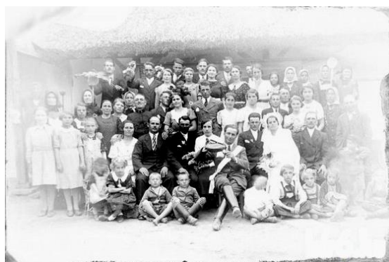
Egy felújított képről készült fénykép

A restaurálás több szinten folyik. Mint a fentebbiekben szó is esett róla, a régi korból származó, illetve az értékesebb tárgyakat szakemberekkel végeztetjük. Ezek a két évtizedes ismeretség, együttműködés folytán eddig még díjtalanul történtek. A gyűjteményünkben található jelentős mennyiségű – korábban padláson őrzött és ott károsodott – üvegnegatívot viszont egy nyugdíjas fényképész mesterrel sikerült konzerváltatni-felújíttatani, aki örömmel és önzetlenül vállalta a felkérést. A harmadik kategóriát jelenti, amikor házilag, rongálás nélküli beavatkozással vagy több ugyanolyan, külön-külön már nem hasznosítható tárgy alkatrészeiből hozunk létre egy új és teljes darabot. Ebben nagy segítséget jelent az önkormányzatnál dolgozó asztalos segítsége. Az iskolás gyerekek például egy ilyen felújított rokkán ismerkedhettek meg a fonás technikájával.