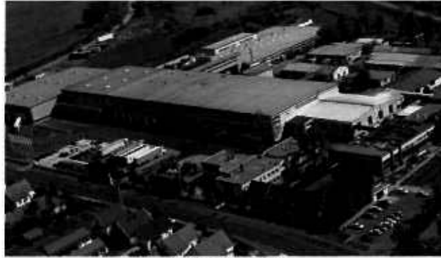
A Henkel gyár