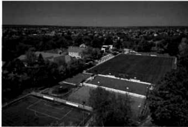
A sport telep

Jelenleg a felnőtt csapat a megyei I. osztályban szerepel.