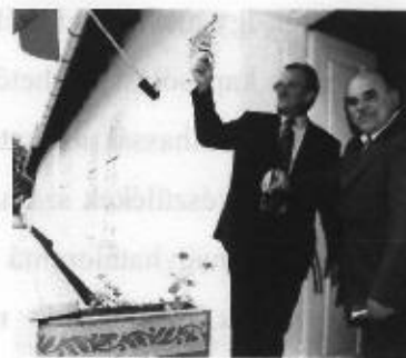
2003. július. 4.

A Körösladányi Helytörténeti Gyűjtemények Háza (későbbiekben: gyűjtemény ) 2003. július 4-én, a Körösladányi Napok alkalmával nyitotta meg ünnepélyes keretek között a kapuját. Az eltelt több mint másfél évtized alatt az önkormányzat képviselőtestülete által hozott határozatának szempontjai alapján végezte munkáját: