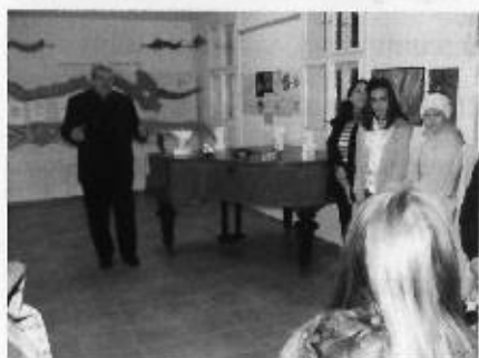
Egy a gyerekek által készített alkotásokat

A fentebbiek alapján némileg érzékelhető, hogy sikeres az a tevékenység, amit a gyűjtemény végez annak népszerűsítése érdekében. Határozottan jelenthető ki, hogy a gyűjtemény mind szélesebb körben vált ismertté a helyi lakosság körében is. Ez részben köszönhető a már iskoláskorban megkezdett foglalkoztatásoknak éppúgy, mint a gyerekek által készített alkotásokból nyílt kiállításoknak. Egyrészt ez is hozzájárul ahhoz, hogy mind több szülő és felnőtt látogatja meg a gyűjteményt. Másrészt viszont az is leszűrhető, hogy sokak viszont különböző megfontolások alapján térnek be a gyűjteménybe. Ez részben a pusztá