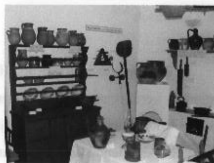
A kiállítás másik részlete napjainkban

Másrészt a helytörténeti anyag számbeli gyarapodása azt is eredményezte, hogy megszülethetett a gyűjteményen belüli képarchívum , amely a festményeken, rajzokon túl Körösladánnyal, az itt éltekkel/élőkkel kapcsolatos régi fotókat is magába foglalja. Utóbbiak többek között alkalmasak a XIX. vége, XX. század néprajzi anyagának vizsgálatára éppúgy, mint történelmi, ill. egyéb dokumentumként. (Alkalmasnak bizonyultak azonban pl. a városháza felújításánál, legutóbb pedig szintén egy régi képeslap alapján lehetett a Hősök szobrának kipusztult bukszus parkját rekonstruálni. Továbbá segítséget nyújthatunk a bennünket megkereső kutatók számára is.) Ezek száma több mint félezer, ami vagy eredeti, vagy digitalizált formában áll a rendelkezésünkre. Emellett még megtalálható 168 helyi vonatkozású, az 1920-as, 30-as és 40-es évekből származó üvegnegatív is, amelyeknek „átfordítása” lassan befejeződik.