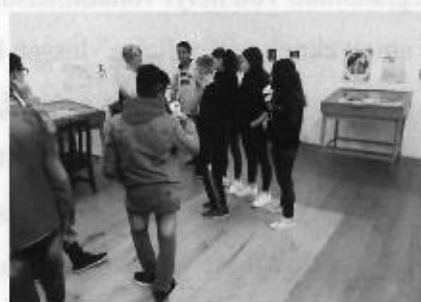
A Nadányiakkal kapcsolatos múzeumpedagógiai foglalkozás egy pillanata

A néprajzi gyűjtemény fontosságát a távolabbról érkezők mellett a helyi általános iskolások képzése is indokolja. A néprajzi alapismeretekkel foglalkozó tantárgyi követelményeket a gyűjteményben interaktív módon egészíthetik ki. Túl azon, hogy a tankönyvi ábrákat itt élõben láthatják, azokat kézbe is vehetik, sõt még a mûködésükkel is megismerkedhetnek (tiloló, gereben, rokka, motolla, csévélõ stb.). Ugyanígy megismerkedhetnek különféle háztartási eljárásokkal (mosás, vasalás, kenyérsütés stb.), illetve iparos szerszámokkal, azok használatával. Az ismeretek elsajátítása után pedig ugyancsak a gyűjteményben zajlik le a feleltetés is.