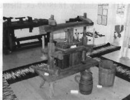
A kiállítás részlete napjainkban

A tetemes növekedés, illetve a kiállítótermek véges volta eredményezte azt, hogy a helyi