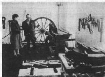
Békés Megyei Népújság

A gyűjtemény alapjait azok a tárgyak jelentették, amelyek az 1985-ben, Végh Mihály által létrehívott helytörténeti kiállítóhelyen voltak láthatók. Ennek mennyisége azonban mára megsokszorozódott. Az örökölt anyagot még az újonnan létesített gyűjtemény kiállítótermeinek berendezése előtt, első lépésként nyilvántartásba vettük. Eszerint az alapállomány 428 darabból állt, aminek több mint fele kiállításra alkalmatlan, hiányos tárgy volt. Ezzel párhuzamosan pedig megkezdődött az az önkéntes felajánlásokon alapuló gyűjtőmunka, ami mindmáig folyamatos maradt. Ennek köszönhetően a bemutatókra alkalmas tárgyak száma: 1781.