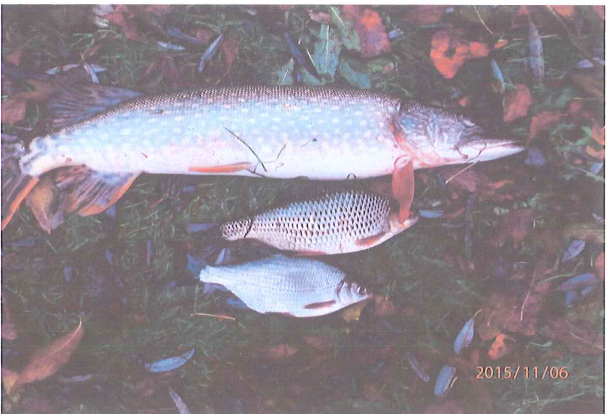
Vegyes horgászszákmány a Sebes-Körösből.