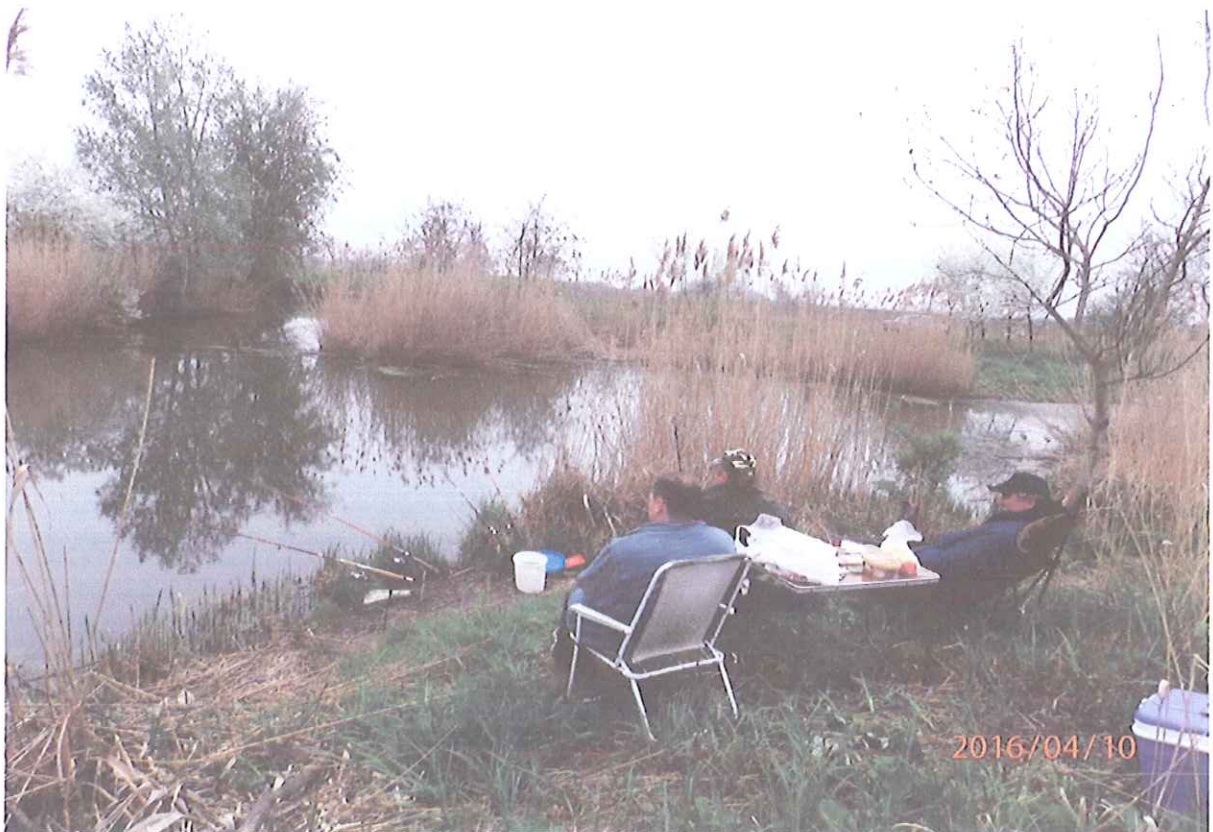
A horgászat barátságot ápol.