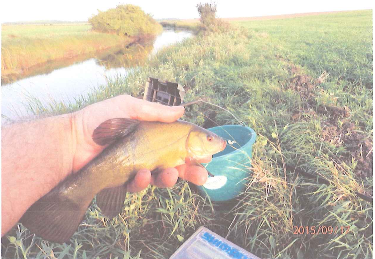
Fokozottan védett halfajunk a compó