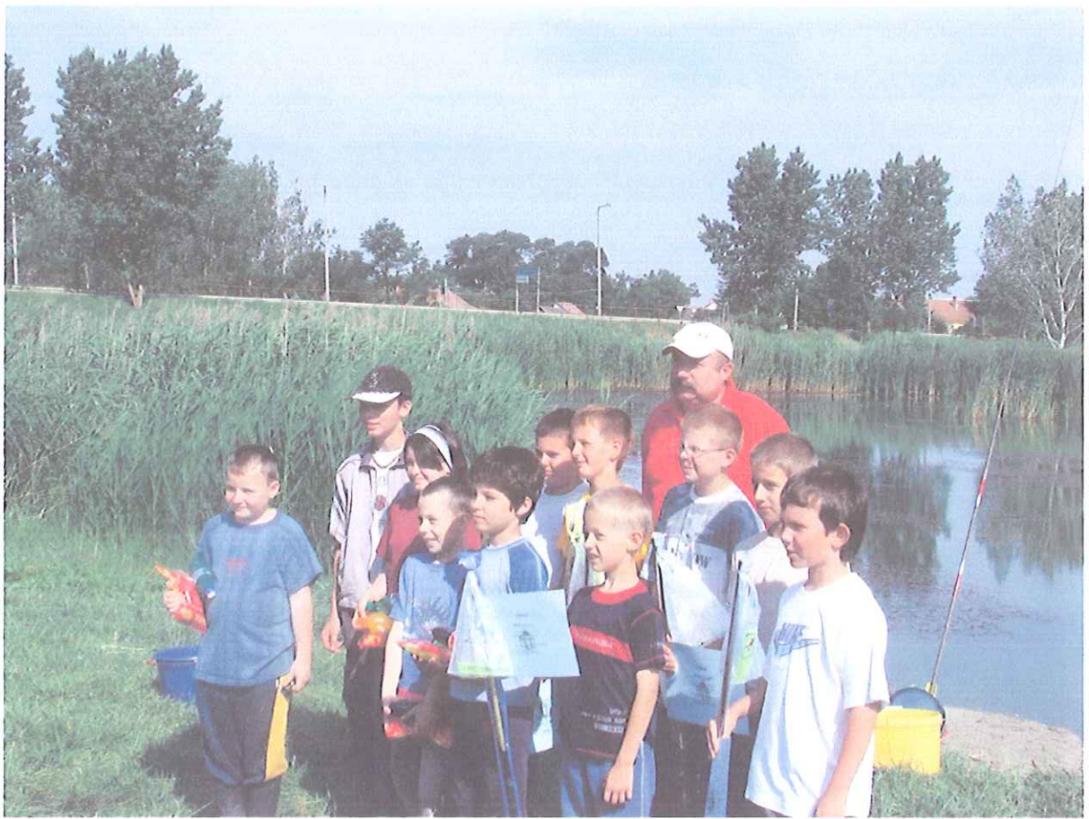
Gyermek és ifjúsági horgászverseny 2007